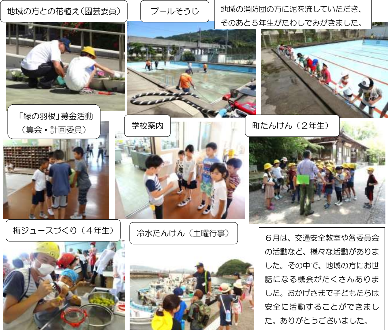
地域の方との花植え(園芸委員)